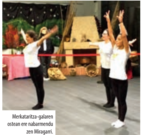
Merkataritza-galaren ostean ere nabarmendu zen Miragarri.

Taldean hainbat kategoria daude, txikienetik hasita senior kategoriaraino. Familia handi honen helburua da eskola-kirola eta federatua babestea. Horretarako,