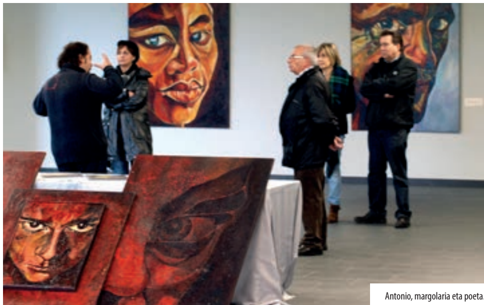
Antonio, margolaria eta poeta.

Derio buru-belarri giza eskubideak aldarrikatzen