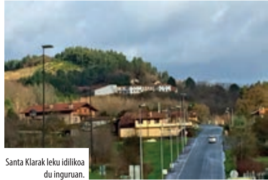
Santa Klarak leku idilikoa du inguruan.

Gabonak Derioko edonork baino debozio eta gogo biziagoz igaro dituzte klaratarrek, gorpuzta eta arima Jainkoari ematen dioten pertsonen gisara. Gela bakoitzean jaiotza bat jarri zuten, eta horien inguruan ibil ziren Jesusen jaiotza ospatzeko, otoitz eginez eta