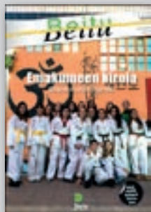
Azaleko argazkia: Doyaneko taekwondolariak