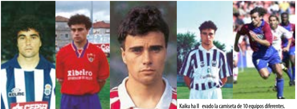
Kaiku ha llevado la camiseta de 10 equipos diferentes.

Su dilatada experiencia le permite marcar diferencias entre el fútbol de Segunda División y el de Primera. En segunda el juego, tanto físico como técnico, está más igualado, y en primera destaca el nivel de los jugadores, “ahí tienes que ser determinante en tu puesto” y en caso de no cumplir, la afición castiga. Fue lo que pasó en Gijón, “realizamos una temporada en primera desastrosa y la afición -por única vez- la tomo conmigo, no fue un año bueno”, admite. Pero también vivió grandes momentos y en Valencia sobre todo: “fue y es mi mejor equipo, en todos los aspectos. En el Levante las cosas siempre me han salido muy bien y fuera del campo me he sentido querido”, además