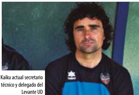
Kaiku actual secretario técnico y delegado del Levante UD