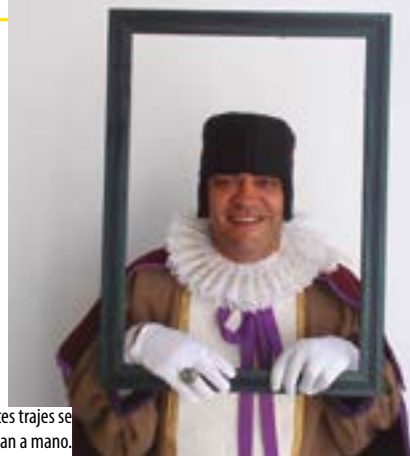
Los diferentes trajes se realizan a mano.