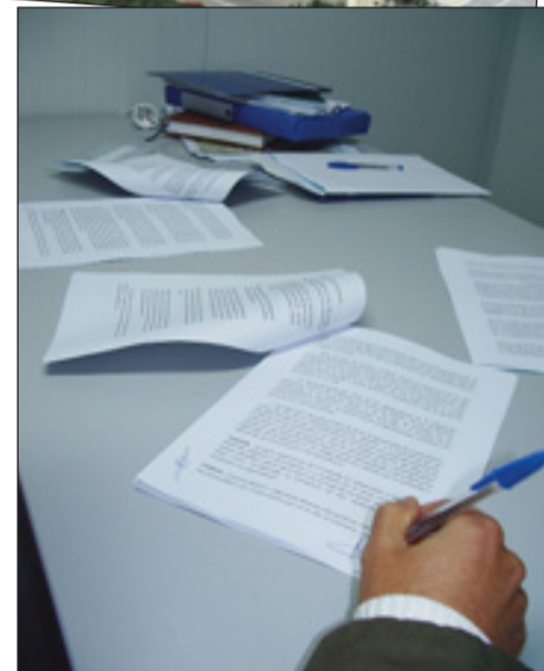
Sinadura: bizitza osorako kontratua

“ Itxaron-zerrendako 26 pertsonak eskuratuko dute etxebizitza ”