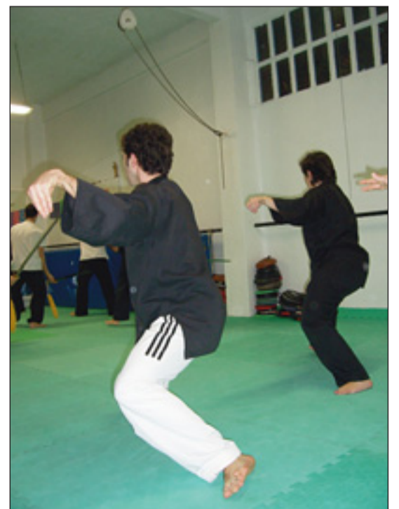
Borroka-arte eta prebentzioko medikuntza

Kiroldegian ere, taekwondo (modalitatek hedatuena) haur-txapelketa egingo da probintzia mailan. Teknika eta Punse txapelketa izango da, eta Derioko 21 partehartzaile egongo dira. Derion 70 pertsonak egiten dute taekwondo eta martxoaren 18an arte horretan lortu duten sinkronizazioa eta goiko maila erakusteko aukera aparta izango dugu.