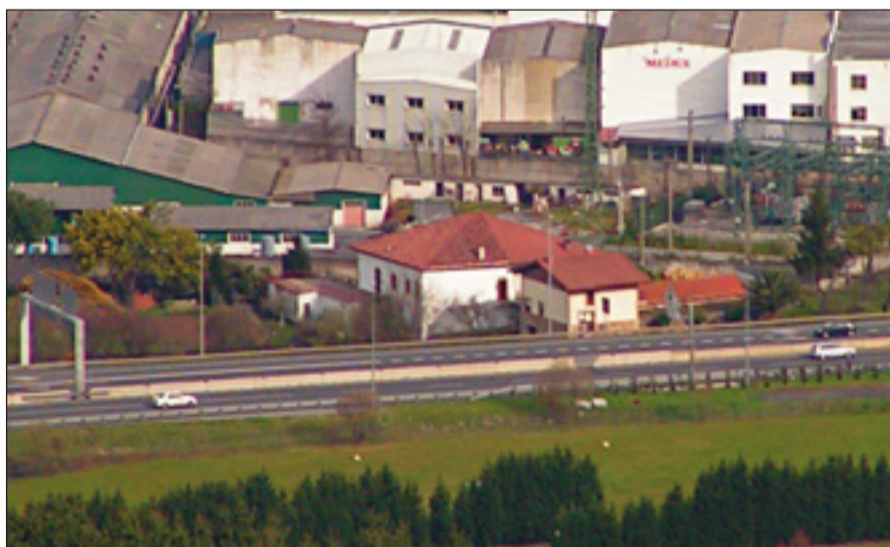
Aresti baserria industria-ingurunean kokatuta