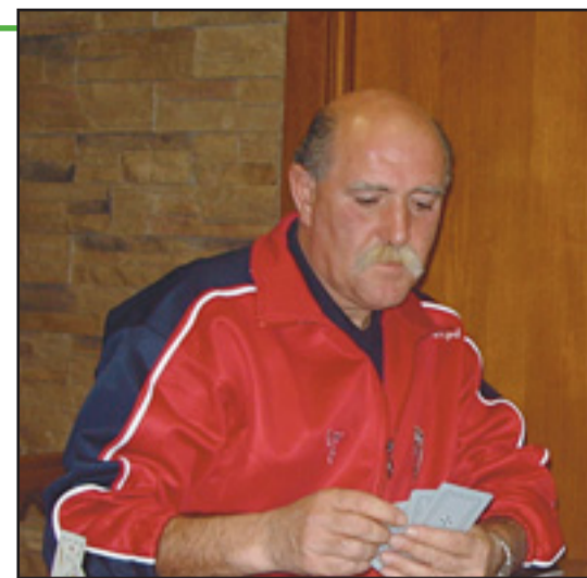
Ondarru Derion karta-partidari hutsik egin gabe

Bai, baina ez da erraza. Futbol erregionala ez dago babestuta eta zuzendaritzakoak eskean ari dira beti; zeregin askotan lan handia egin behar da, baina ez dute etekinik ematen. Eta deriotarrek egiten badute... Derio horrelakoa da... taldearen alde beti.