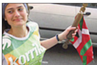
15. Korrika emakumeen omenez

“ Aurtengo Korrika gaueko 22:45ean helduko da ”