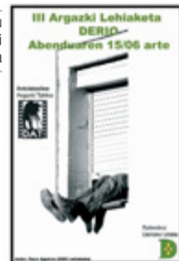
DATek honela aurkeztu digu bere hirugarren argazki lehiaketa

Los trabajos se podrán entregar en la Biblioteca hasta el 15 del mes que viene y el fallo del jurado se conocerá el sábado 23 a las 12:30 horas en Larrabarri. Allí se entregarán los más de 300€ en premios, más los diplomas a los mejores trabajos y el especial para la mejor fotografía realizada por un deriotarra. Al mismo tiempo se inaugurará una exposición con las mejores imágenes presentadas. ■