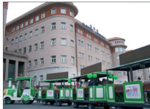
Txikientzako jarduerak goizean Seminarioan egin ziren.

Comerciantes. Madrugamos para acercarnos hasta el Seminario en un tren chu-chu puesto ex-profeso para la ocasión, el tiempo acompañaba y fueron muchos los que se acercaron a degustar txakoli o un pintxo mientras veían disfrutar a los más pequeños en la variedad de actividades propuestas. A la tarde se sucedieron los actos hasta la madrugada, música, concursos, bailes y un goteo incesante de personas que vivían un peculiar sábado. Lo más provechoso y memorable de la cita ver a los hosteleros, hasta ahora desunidos, trabajando y colaborando codo con codo. Era necesario y los beneficios los veremos todos, de momento nos obsequiarán con una gran fiesta que contó con la ayuda inestimable del Ayuntamiento. ■