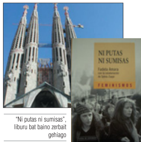
“Ni putas ni sumisas”, liburu bat baino zerbait gehiago

“Bidaiariak, nekaezinak, Sutondoan geldiezina”