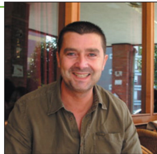
Santos, elkarte handi baten buru den ostalari gaztea.

Debe ser y lo es. A nadie le gusta tener un bar debajo de casa, pero todo el mundo sale a tomarse un café o un refresco. Lo importante es dar un servicio.