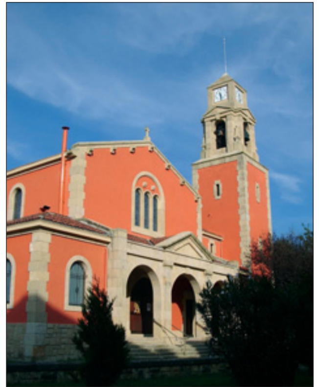
Kofradiak San Isidro elizan eman zituen lehenengo urratsak

“ Derio berriak izango dituen auzokideak erakartzea da erronka ”