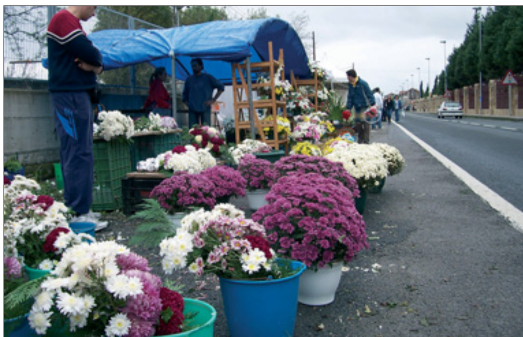
Aurten ez da auto-ilararik eta jende pilaketarik egon