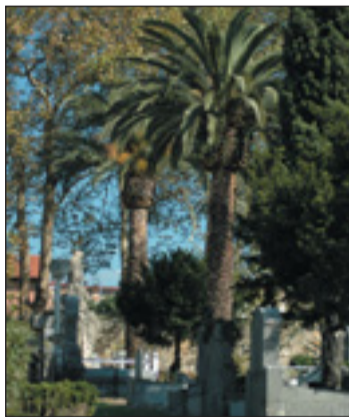
Gure hilerrietatik ibiliz, irakurri beharreko historia-museoa ageri zaigu

En cuanto a la construcción del edificio principal, como por ejemplo la capilla central y los corredores laterales, es de inspiración neorrománica y ha sido recientemente restaurado, al visitante le sorprenderá por el azul celeste de sus techos y el juego de luces y sombras producido por las numerosas columnas que lo sustentan. ■