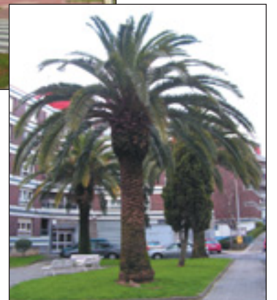
Derioko bazterrak: Kanarietako palmondoa eta amodio-zuhaitza protagonistak