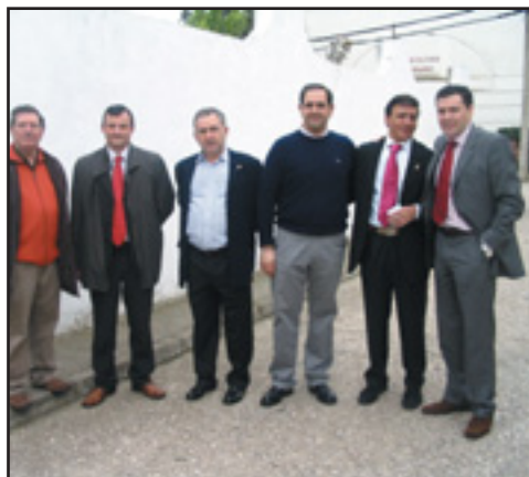
La bienvenida que ofrecieron en Hinojal a nuestros representantes fue más que calurosa

Martxoaren azken asteburuan, Caceres-ko herri honen udalak eta gure udalaren hainbat ordezkari elkartu egin ziren aipatutako herrian. Orain dela urte bi ekitaldi bat antolatu genuen gure herri hori gonbidatzeko, eta oraingoa ekitaldi horri emandako erantzuna izan da. Alkaterekin eta zenbait zinegotzirekin batera, Sutondoan taldearen ordezkariak, eta Derioko herritar ugari joan ziren topaldira.