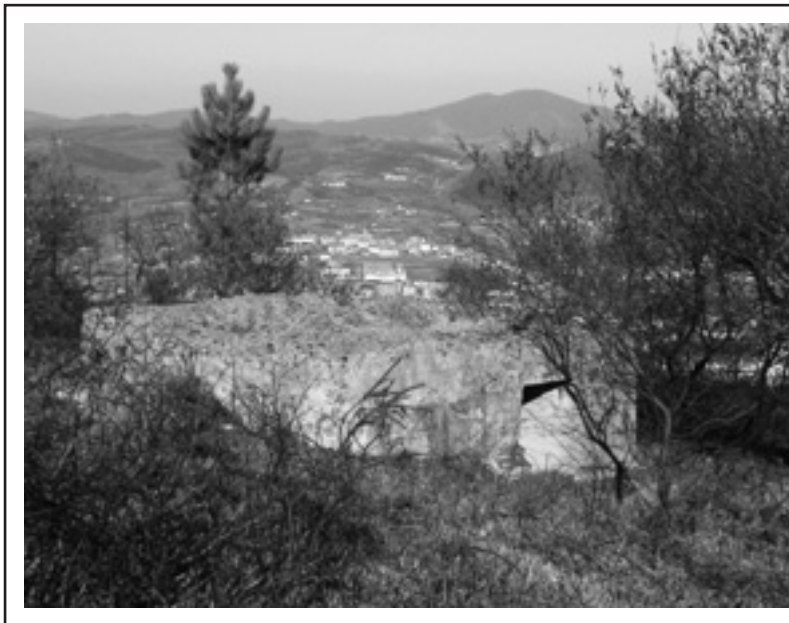
El búnker del Monte Avril, un referente de tiempos pasados

“ XX. mendearen lehenengo seihilekoan: aldaketarako denbora ”